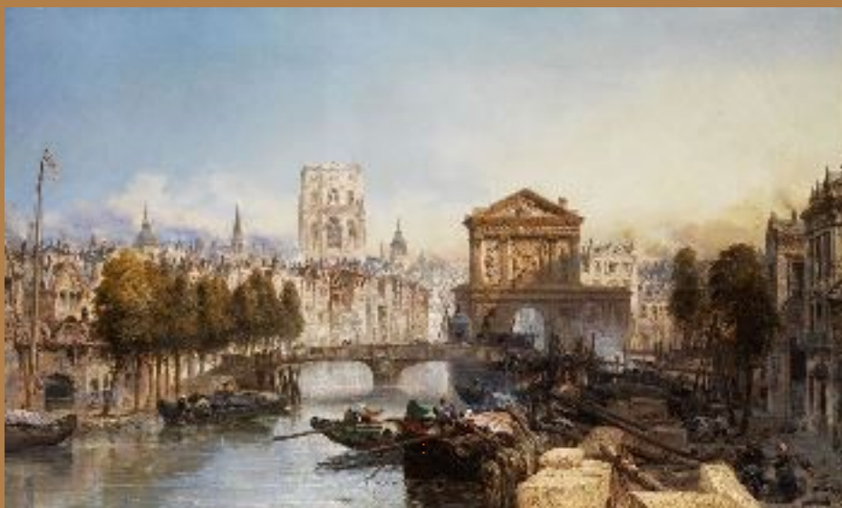
Gezicht op de Rotterdamse haven 1876