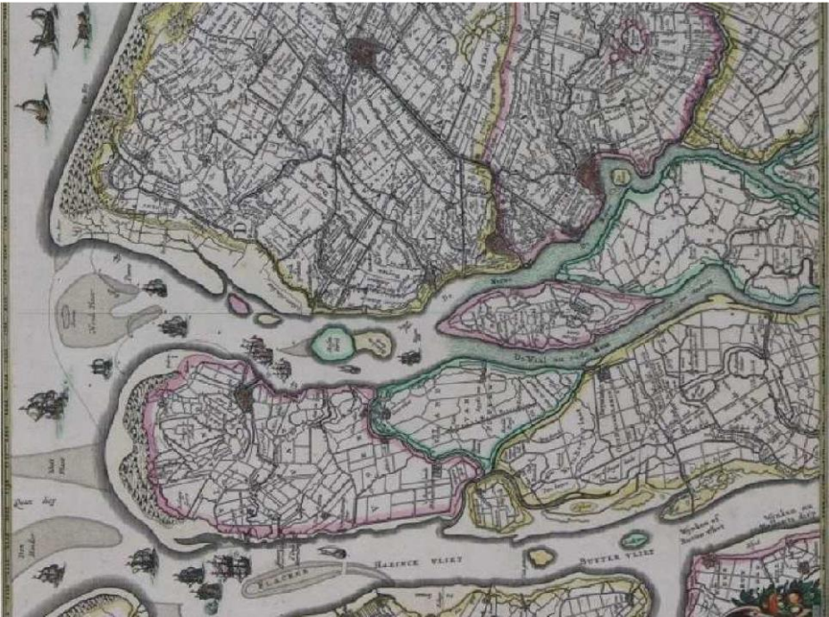
(Kaart van Delfland, Schieland, Voorne-Putten, Goeree en IJsselmonde van Balthasar Florisz.)

Nadere informatie op de volgende pagina's.