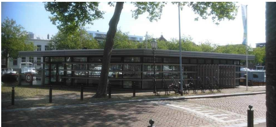
Museumpaviljoen De Joon